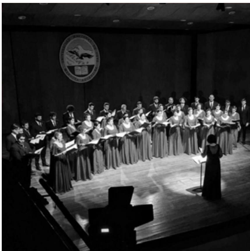
CORO UNIVERSITARIO DE MENDOZA