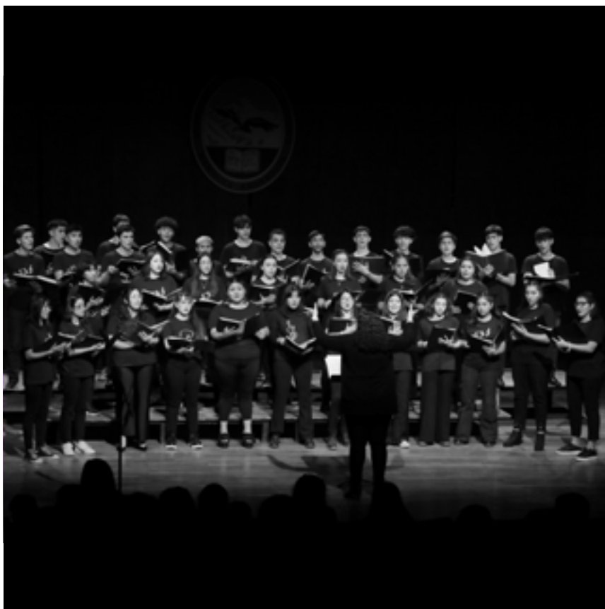
CORO DE JÓVENES UNCUYO