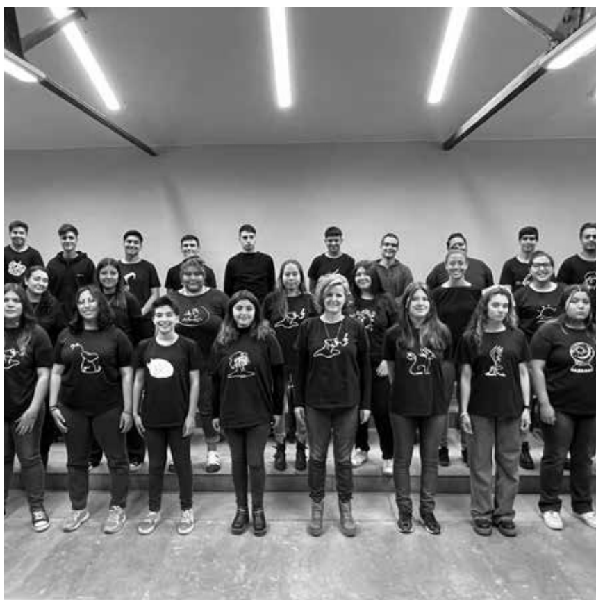
CORO DE JÓVENES UNCUYO